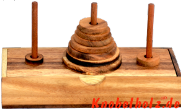
Turm von Hanoi mit 9 runden Scheiben. Bringe den Turm vom Mittleren Stab auf einen Seitenstab....aber Du darfst nur eine Scheibe nehmen und keine kleine auf eine große Scheibe legen...nur kleine auf größere...