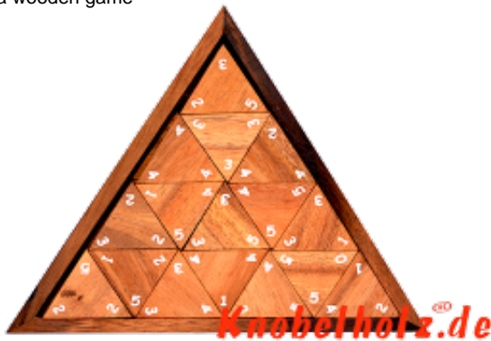
Triomino Number Triangle das Dreiecks Domino mit 3 eckigen Dominosteinen und Zahlen anstelle der farbigen Punkte ....hier legen wir so an das je 2 Zahlen übereinstimmen....interessantes Domino für bis zu 8 Spieler....