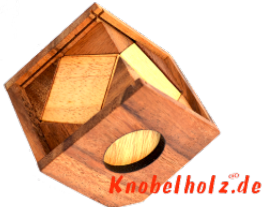
Triangle Cube Puzzle hat alles nur spitze oder stumpfe Winkel an den Holzteilen irgendwie sollen alle zusammen ein Würfel ergeben...