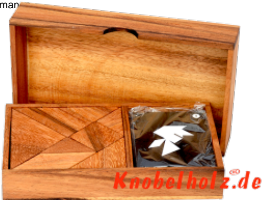
Tangram in der Battle Version für 2 Spieler auch ein altes chinesisches Puzzle lässt sich als kleines Wettspiel gestalten....lege mit 7 Teilen über 1200 Figuren mit einem Gegenspieler