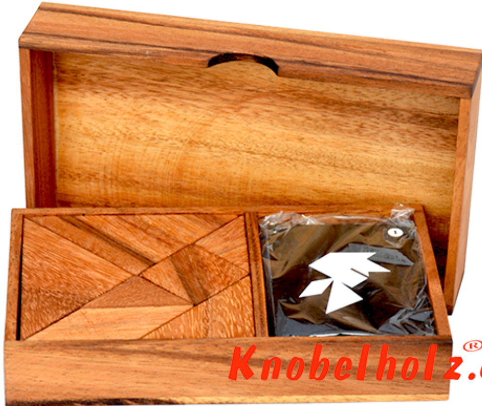
Tangram 7 Battle Box mit Cards als Vorlagen Holzpuzzle Reiseversion Maße 16,0 x 9,1 x 2,5 cm , tangram 7 battle puzzle for 2 player saman