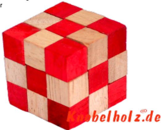
Schlangenwürfel medium der Snake Cube Rot M aus Samanea Holz das Knobelspiel in 3D mit 27 kleinen Würfeln welche wieder einen Würfel 3x3x3 bilden tolles IQ-Spiel ...