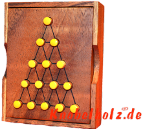
Last Fighter large Solitaire in der anderen Version Du kannst einen beliebigen Stein entnehmen und starten.....springe jeweils über einen Stein und nimm ihn raus das einer übrig bleibt ????????? ???? ????????