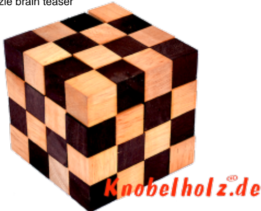
Cobra Cube Schlangenwürfel large der Cobra Cube L aus Samanea Holz das Knobelspiel in 3D mit 64 kleinen Würfeln welche wieder einen Würfel 4x4x4 bilden tolles und sehr schweres IQ-Spiel ...