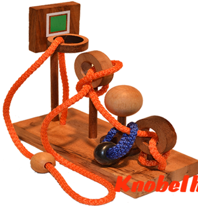
NBA Basketball Schnurpuzzle, Basketball Holz Puzzle, Denkspiel Knobelaufgabe in den Maßen 16,0 x 7,0 x 16,0 cm, Samanea wood brain teaser