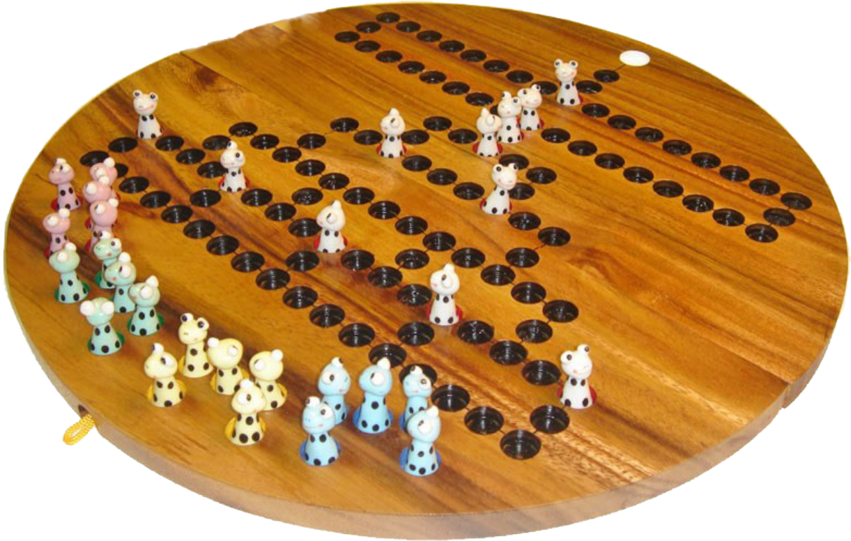
Barrikade Frog, Blockade Würfelspiel aus Samanea Holz mit den Maßen 39,0 x 39,0 x 3,5 cm , barricade wooden game board round monkey pod